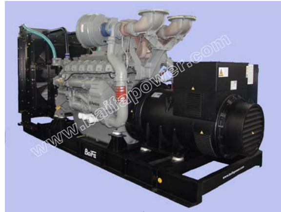
机组外形, 仅供参考