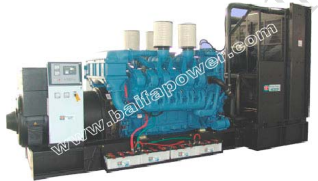
机组外形, 仅供参考