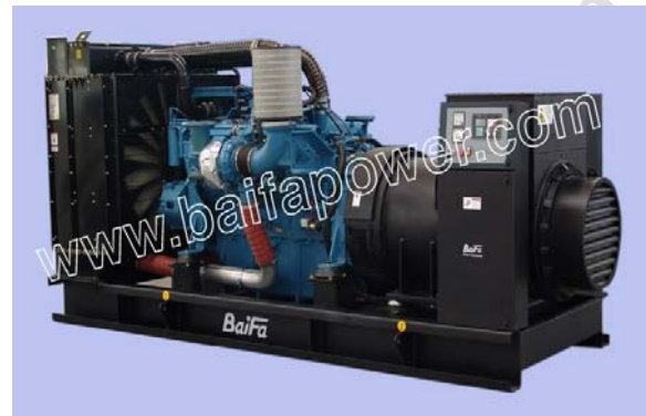
机组外形, 仅供参考